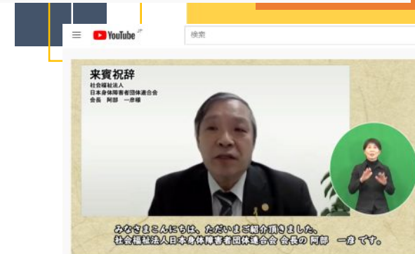
第41 回日本身体障害者団体連合会近畿ブロック福祉大会・第23 回近畿ブロック身体障害者相談員研修会(兵庫県大会)