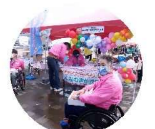
みんなの声かけ運動の推進