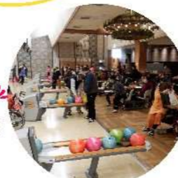
文化・スポーツ振興