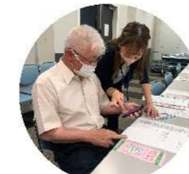
身体障害者の自立支援