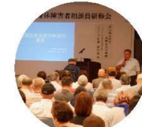
各種研修会の開催